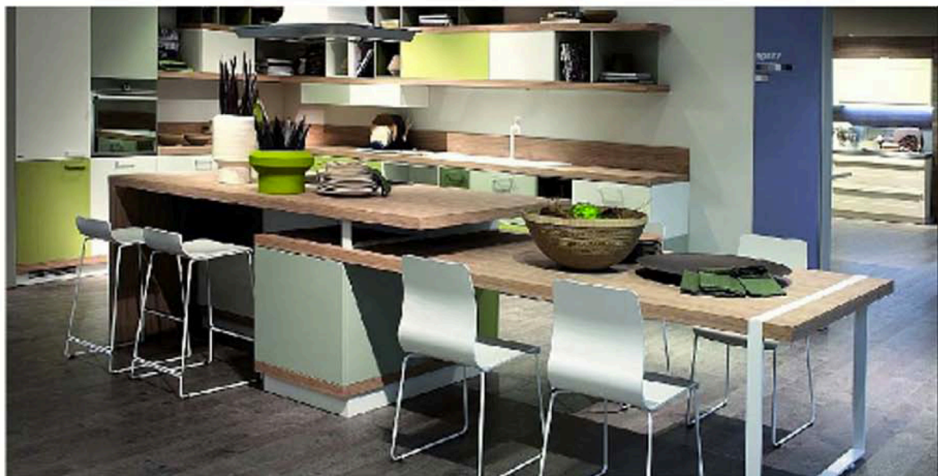
Foodshelf (design Ora-Ita)

quindi dal presupposto che è la zona living ad entrare in cucina e a suggestionarla con i suoi schemi compositivi, con il rapporto tra pieni e vuoti e, soprattutto, con l'approccio dinamico delle nuove iconografie living.